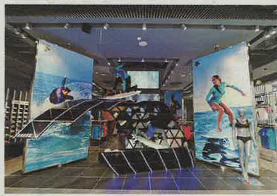
韓国では自社ブランド「デサント」が好調(デサント漢江店)

突破。1998年に独アデ イダスのライセンス契約終 了で売上高の4割を失った が、韓国市場で急成長を果 たし、後遺症から脱した。 今期の海外売上高比率は初