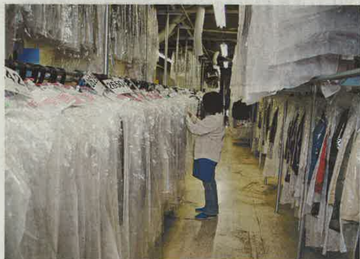
喜久屋は保管付きクリーニングサービスに、何度でも出し入れ可能な収納機能を追加する

10月1日に従来の保管 付きクリーニング「イー クローゼット」を全面リ ニューアルする。二つの コースを設け、一つは一 定の着数の範囲で衣類を 何度でも出し入れできる ようにする。ともに申し 込みはインターネットで 受け付ける。保管期間は6 ヶ月、1年をオプションで 選べる。月会費はプラ ンごとに500〜1000 円程度を想定し、送料 は無料を検討。ただし、 預けるたびにクリーニング 代が発生する。 もう一つのコースは、 従来通り喜久屋がクリー ニング後にまとめて保管