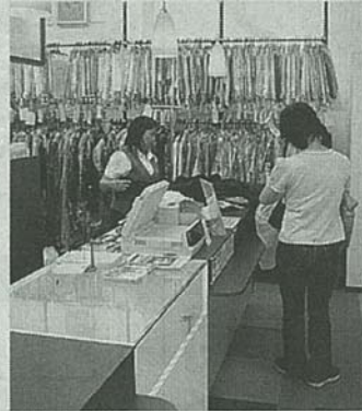
喜久屋はプレミアム会員サービスで顧客の困り込みを狙う