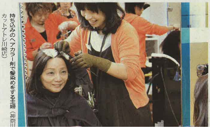
持ち込みのヘアカラー剤で髪染めをする主婦(神奈川県川崎店)

無駄な買い物は避けるが、価値があると認めたものにはお金を使う。消費者の意識調査では「節約」の範囲が広がっている。メリハリ消費派が最も多く、全体の56.0%を占め、全ての支出を抑える「コソコソ節約」派は9.4%にとどまった。4月以降に節約をしていると答えた人が全体の65.4%を占めた。世帯年収別では100万円〜300万円未満が75.0%と最も節約志向が高く、800万円〜1000万円未満が57.8%と最も小さかった。節約している品目(複数回答)は、1位が「外食」(54.0%)、「ケーキなど菓子」(42.0%)。節約方法は「購入頻度を減らした」が80.7%と最も多かった。一方で「米やパンなど主食」は節約対象から外す人が多く、不要不急の消費を抑えつつ、生活の質は落とさたくない傾向が強かった。